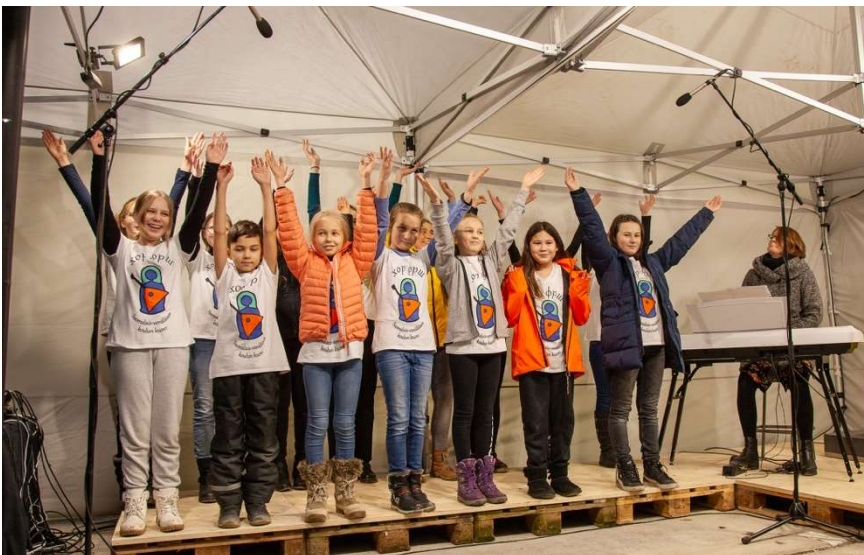
Koulun kuoro esiintyi.

Hankkeen tavoitekustannus on noin 25 miljoonaa euroa ja se toteutetaan Senaatin kärkihankeallianssina.