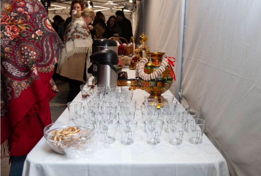
Juhlatarjoilut perinteisellä tyyllillä.