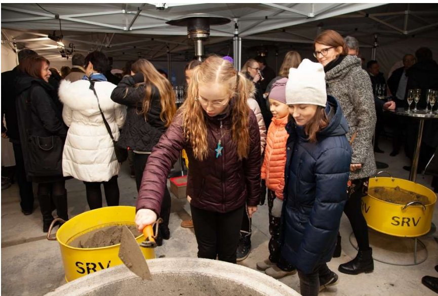
Oppilaita muurauksuhan varressa.