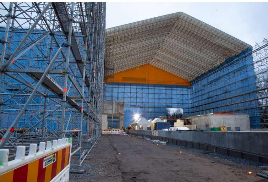
Uutta koulua rakennetaan sääsuojan alla.