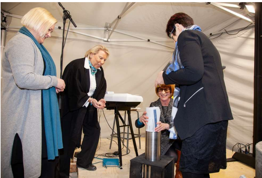
Rehtorit täyttivät peruskiveen muurattavan lieriön.